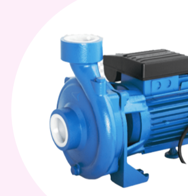
Bomba de agua