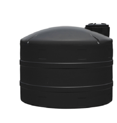
Tanques de almacenamiento