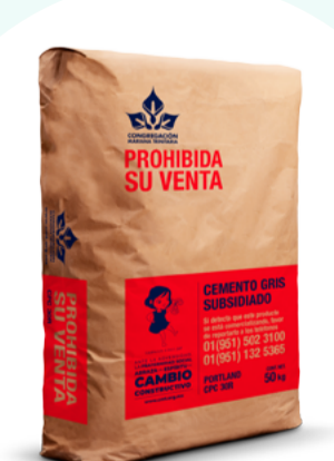
Cemento y mortero