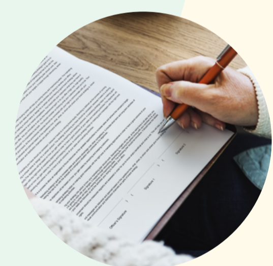
Seguros de vida