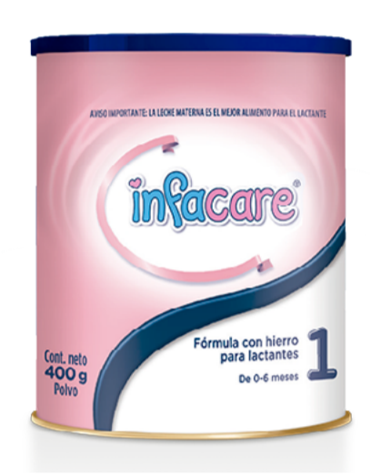
Leche en fórmula