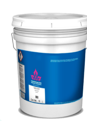
Pintura, impermeabilizante, sellador, esmalte y disolvente