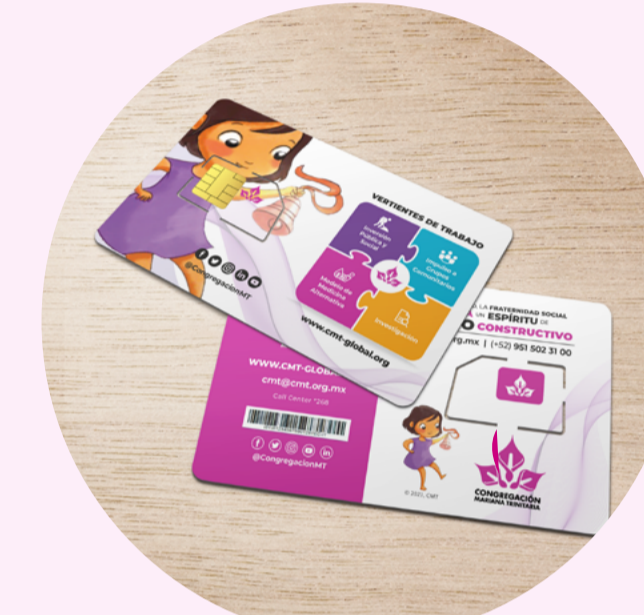
Plan de Conectividad