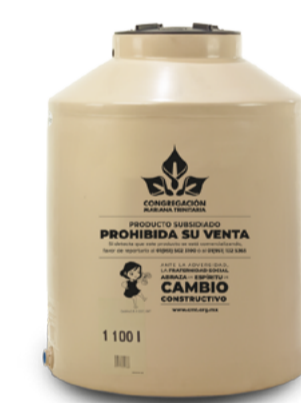
Tinaco tricapa y bicapa